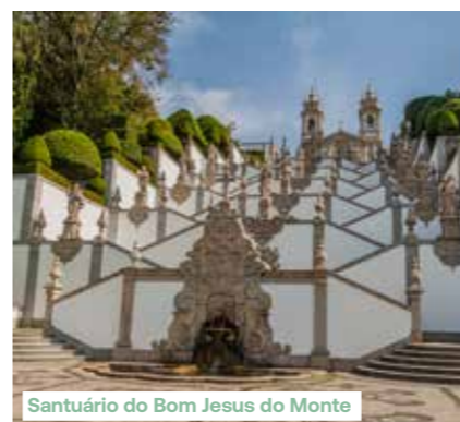
Santuário do Bom Jesus do Monte

In de voormiddag vertrekt u met de autocar naar Braga. De stad, die haar bijnaam 'Rome van Portugal' dankt aan haar grote aantal kerken, heeft een rijk architecturaal en historisch verleden. Ook vandaag is Braga nog altijd een van de belangrijkste religieuze centra van het land. Net buiten de stad ligt het Santuário do Bom Jesus do Monte. De grote trap die naar de top leidt,