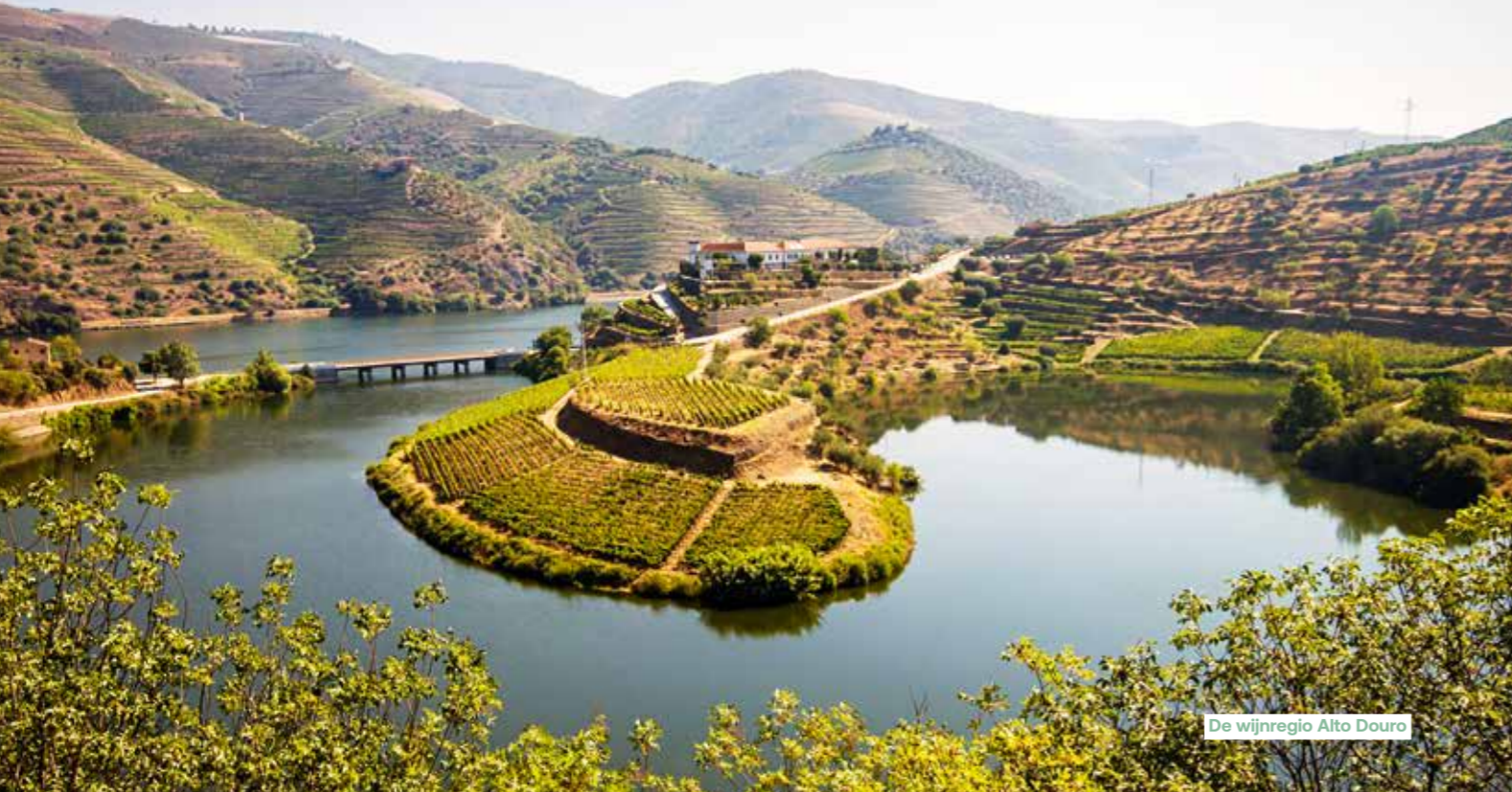
De wijnregio Alto Douro