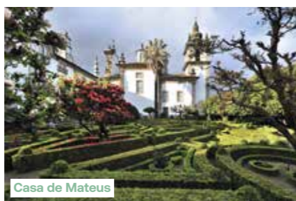
Casa de Mateus

Met een lijnvlucht vertrekt u vanuit Brussel naar Porto. Na aankomst wordt u naar het schip in de haven Vila Nova de Gaia gebracht waar u aan boord stapt van de M/S Queen Isabel. 's Avonds wordt u verwelkomd aan boord met een cocktail en een diner. Bem-vindo em Portugal!