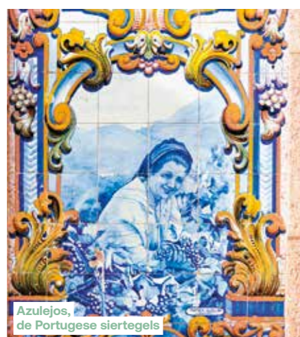
Azulejos, de Portugese siertegels

De volgorde van de bezoeken kan gewijzigd worden naargelang de vluchten, vaarroute of technische specificaties. Door weersomstandigheden kan een aanlegplaats geannuleerd of vervangen worden: dit kan enkel beslist worden door de kapitein die altijd een oplossing zal zoeken zo voordelig mogelijk voor de passagiers.