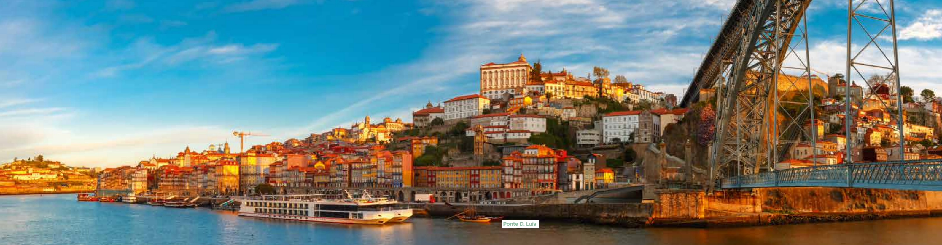
Ponte D. Luís

Unesco-werelderfgoed. De op een na grootste stad van Portugal is een lust voor het oog: met een doolhof van straatjes, kleurrijke vissershuisjes, azulejos, bloemrijke balkons en winkelstraten. De huizen liggen als het ware tegen de steile oevers van de Douro geplakt, die hier zijn lange weg door Spanje en Portugal beëindigt. De iconische dubbeldeksbrug (Ponte D. Luís) is ontworpen door het Belgische bedrijf Willebroeck. Ingenieur Théophile Seyrig was een leerling van Gustave Eiffel. Op de hoogste heuvel van de oude binnenstad bezoekt u de kathedraal Sé. Vanop het plein hebt u een prachtig uitzicht op de rivier en de