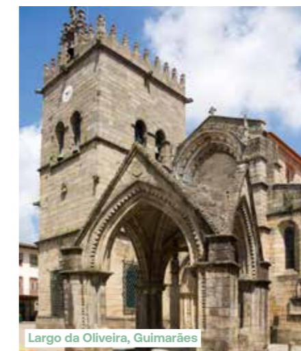
Largo da Oliveira, Guimarães

onafhankelijkheid van het land en fungeerde als eerste hoofdstad. Ontdek het voorbeeldig gerenoveerde middeleeuwse stadscentrum met een bijzondere architecturale homogeniteit. Een wirwar van straatjes verbindt de pleinen met elkaar, waaromheen oude huizen van graniet staan. Het plein Largo da Oliveira, of Olijfboomplein, is een opmerkelijk goed bewaard middeleeuws complex. Bezoek het paleis van de hertogen van Bragança, waarvan de architectuur doet denken aan de kastelen van Bourgogne. Terugkeer naar het schip in Porto en overnachting aan wal.