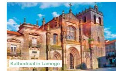
Kathedraal in Lamego

kathedraal uit de 12e eeuw, die in de loop der eeuwen vele malen werd verbouwd en daardoor vandaag een bijzonder eclectisch geheel van stijlen laat zien. Daarna staat een bezoek aan het museum van Lamego op het programma. In het voormalige bisschoppelijk paleis uit de 18e eeuw ontdekt u een collectie beeldhouwwerken, schilderijen en wandtapijten van onschatbare waarde. Folkloristische voorstelling aan boord.