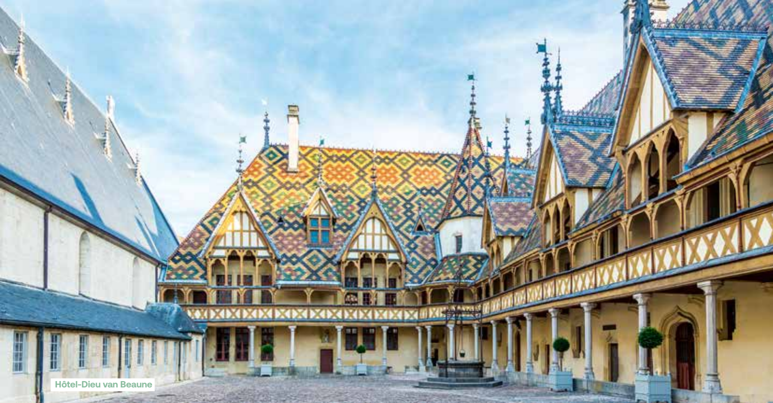
Hôtel-Dieu van Beaune