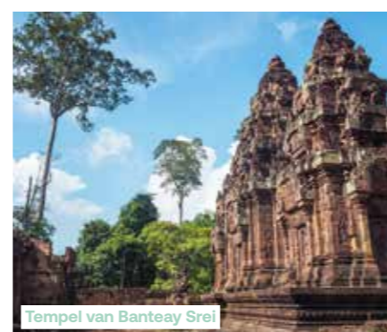
Tempel van Banteay Srei

restaurant in Siem Reap. Eerste ontdekking van Siem Reap met het bezoek van een dorp gelegen aan de oevers van het Tonlé Sapmeer. Diner in het restaurant en overnachting in het Sokha Angkor Resort 5* (of vergelijkbaar).