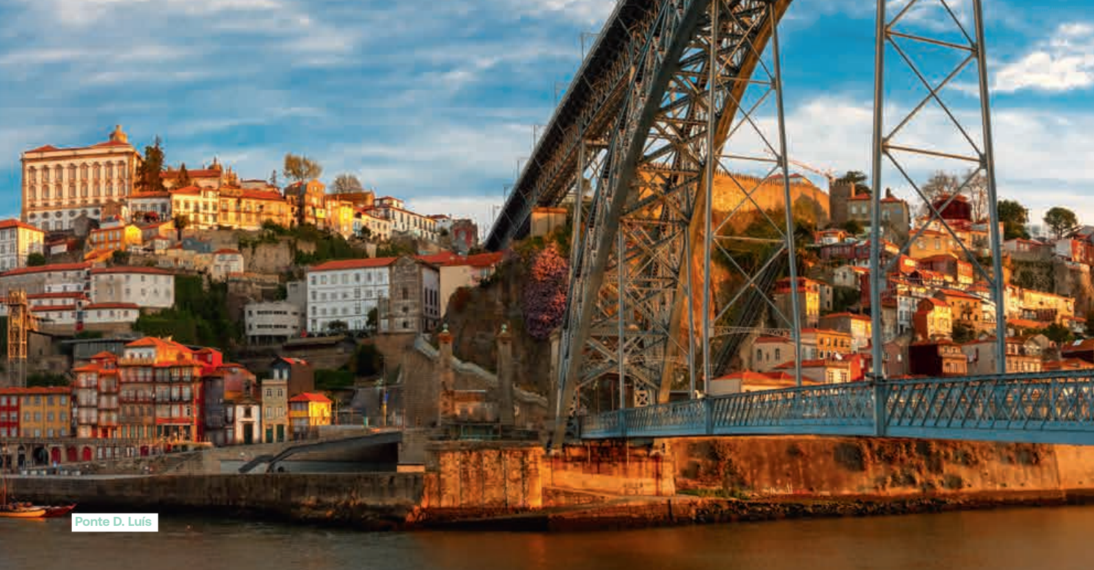
Ponte D. Luis