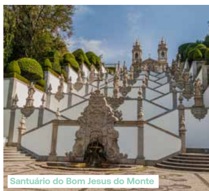
Santuário do Bom Jesus do Monte

Porto en de geboortestad van de eerste koning van Portugal, Afonso Henriques. De stad speelde een belangrijke rol in de onafhankelijkheid van het land en fungeerde als eerste hoofdstad. Ontdek het voorbeeldig gerenoveerde middeleeuwse stadscentrum met een bijzondere architecturale homogeniteit. Een wirwar van straatjes verbindt de pleinen met elkaar, waaromheen oude huizen van graniet staan. Het plein Largo da Oliveira, of Olijfboomplein, is een opmerkelijk goed bewaard middeleeuws complex. Bezoek het paleis van de hertogen van Bragança, waarvan de architectuur doet denken aan de kastelen van Bourgogne. We lunchen in een restaurant. In de namiddag vertrekt u met de