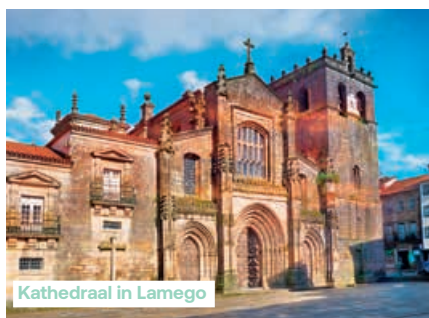
Kathedraal in Lamego

's Ochtends vaart de M/S Queen Isabel vanuit Porto door de Dourovallei langs pittoreske witte dorpjes die verscholen liggen tussen de olijf-, wijn- en boomgaarden. Laat de indrukwekkende landschappen aan u voorbijglijden. Lunch is voorzien aan boord. Kort na de middag meren we aan in Régua, de poort tot de wijnregio Alto Douro (Hoge Douro), gevormd door duizenden jaren wijnbouw. Deze stad midden in de vallei was het hart van de wijnhandel in de 13e eeuw. We bezoeken er het moderne museum van de Douro, gelegen in een oud magazijn. Het museum wil het erfgoed van de wijngebieden langs de bovenloop van de Douro, die opgenomen zijn als Unesco-werelderfgoed, beschermen en promoten.