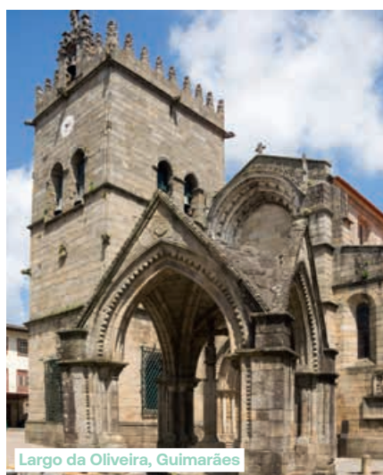
Largo da Oliveira, Guimarães

autocar naar Braga. De stad, die haar bijnaam 'Rome van Portugal' dankt aan haar grote aantal kerken, heeft een rijk architecturaal en historisch verleden. Ook vandaag is Braga nog altijd een van de belangrijkste religieuze centra van het land. Tijdens een wandeling door het oude centrum bewonderen we de vele kerken en historische gebouwen en brengen we een bezoek aan de kathedraal Sé. Het religieuze bouwwerk dateert uit de 12e eeuw en is niet alleen hét symbool van de stad, maar ook de oudste kathedraal van het land. We eindigen de dag