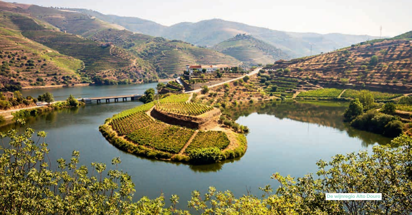
De wijnregio Alto Douro