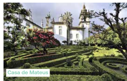
Casa de Mateus

richting Casa de Mateus. We krijgen een rondleiding in dit elegante landhuis uit de 18de eeuw, dat een echt barokjuweel is, en bezoeken ook de tuinen. Met lanen vol bloemen, exotische planten en een tunnel van cipressen vormt het een subliem voorbeeld van landschapskunst. Het meer, waarin het prachtige gebouw wordt weerspiegeld, vormt op dat vlak de kers op de taart.