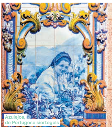
Azulejos, de Portugese siertegels

vertrekt u met de bus naar Porto voor een stadsbezoek. Het fraai gerestaureerde historische centrum prijkt sinds 1996 op de lijst van Unesco-werelderfgoed. De op een na grootste stad van Portugal is een lust voor het oog: met een doolhof van straatjes, kleurrijke vissershuisjes, azulejos, bloemrijke balkons en winkelstraten. De huizen liggen als het ware tegen de steile oevers van de Douro geplakt, die hier zijn lange weg door Spanje en Portugal beëindigt. De iconische dubbeldeksbrug (Ponte D. Luís) is ontworpen door het Belgische bedrijf Willebroeck. Ingenieur Théophile Seyrig was een leerling van Gustave Eiffel. Op