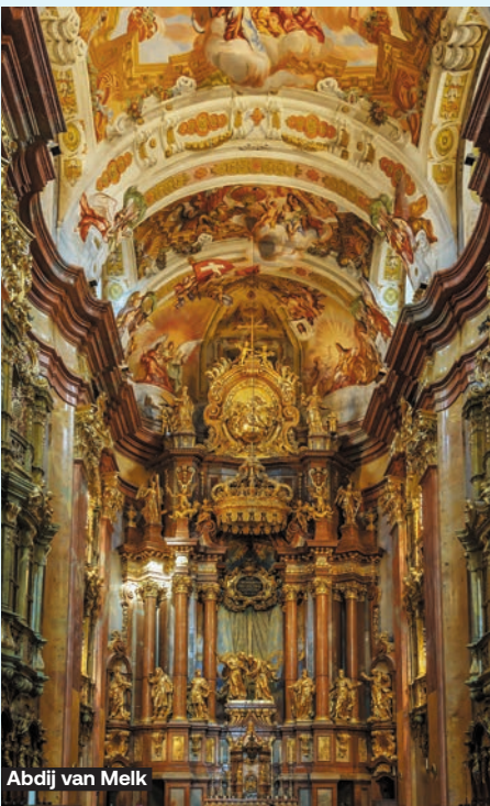
Abdij van Melk

De wereldberoemde abdij van Melk is een van de mooiste voorbeelden van de barokke architectuur uit de periode van de contrareformatie. De abdij maakt deel uit van het Unesco-werelderfgoed. Na een uitgebreid bezoek aan de abdij en de tuinen volgt een niet te missen wijndegustatie. Prijs per persoon: € 70 (halve dag)