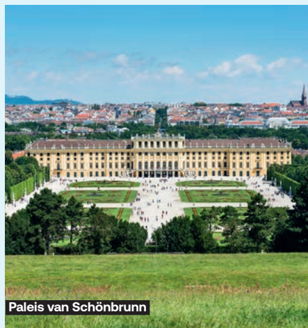
Paleis van Schönbrunn